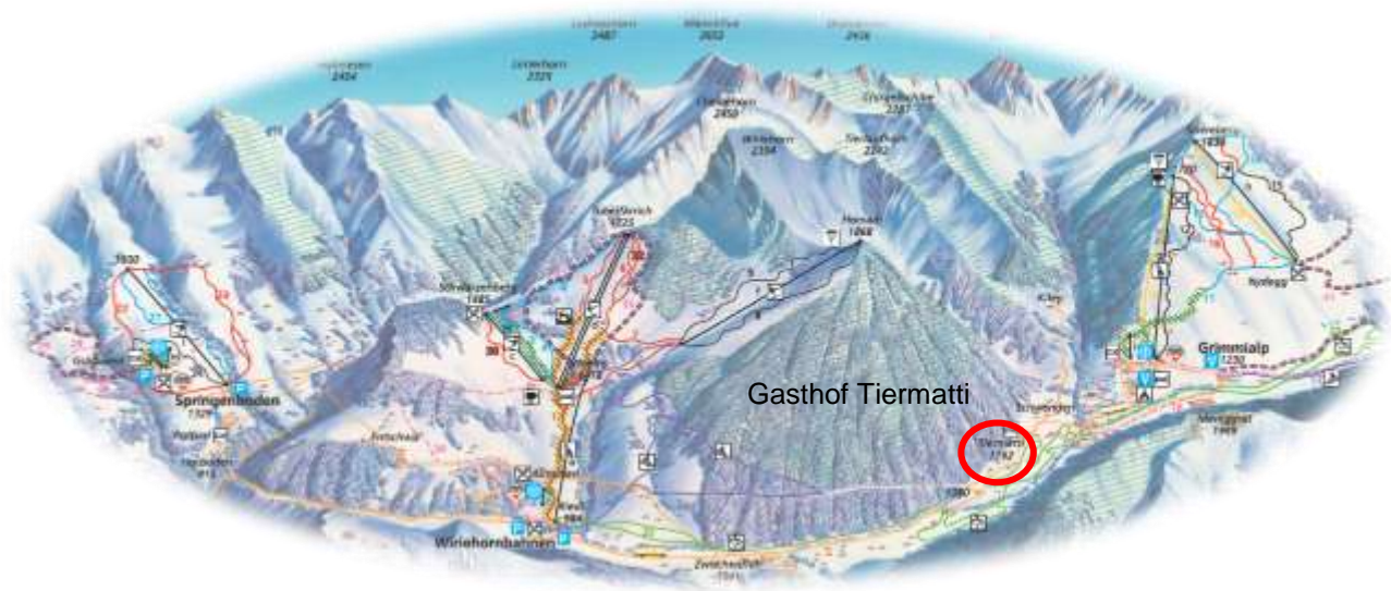
Abbildung 2: Übersicht Winterkarte Diemtigtal

Die Bergbahnen Grimmelalp und Wiriehorn sind in wenigen Fahrminuten erreichbar. Von Thun oder Bern dauert die Fahrt zum Tiermatti rund 30, respektive 45 Minuten.